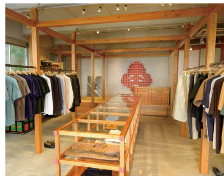
本社近くにある IKIJI STORE。 ロゴマークは江戸時代の浮世絵師兼戯作者、 山東京伝の「面（つら）の皮梅」から

TSSはトヨタの自動車製造工場の仕組みを縫製工場に当てはめたもので、必要なものを、必要なときに、必要なだけ生産することを可能にするシステム。それまで採用していたロット生産は、一人の工員が単工程を担当し、担当工程を施した仕掛品（未完成の製品）の数がたまったら、次の担当に回す、というシステム。この方法だと、数をためて運ぶという無駄な作業があるので、どこかでミスが